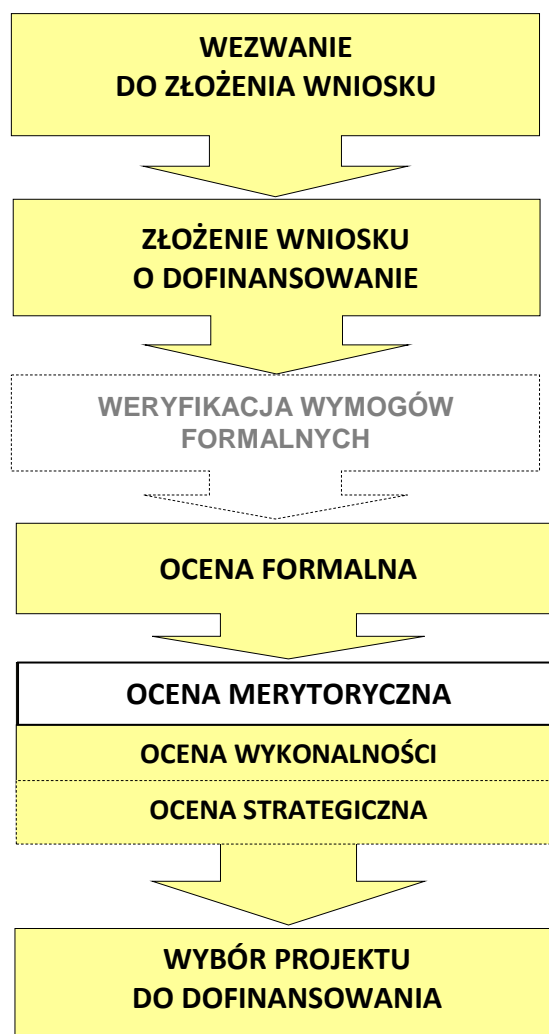
Rys. 2. Schemat wyboru projektów w ramach RPO WP (tryb pozakonkursowy).

W trybie pozakonkursowym wnioski o dofinansowanie projektów składane są na wezwanie IZ RPO WP przez podmioty uprawnione (tj. wskazane w Wykazie ) w terminie określonym przez IZ RPO WP, spójnym z przewidywanym terminem złożenia wniosku o dofinansowanie zamieszczonym w Wykazie .