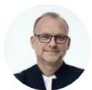
Michał Guć wiceprezydent Gdyni