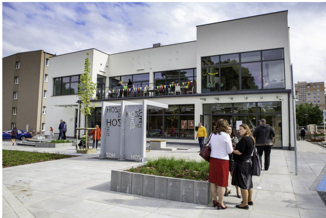
Centrum sąsiedzkie Przystań Opata Hackiego 33

Dalsza kontraktacja wstrzymana do rewizji RPO.