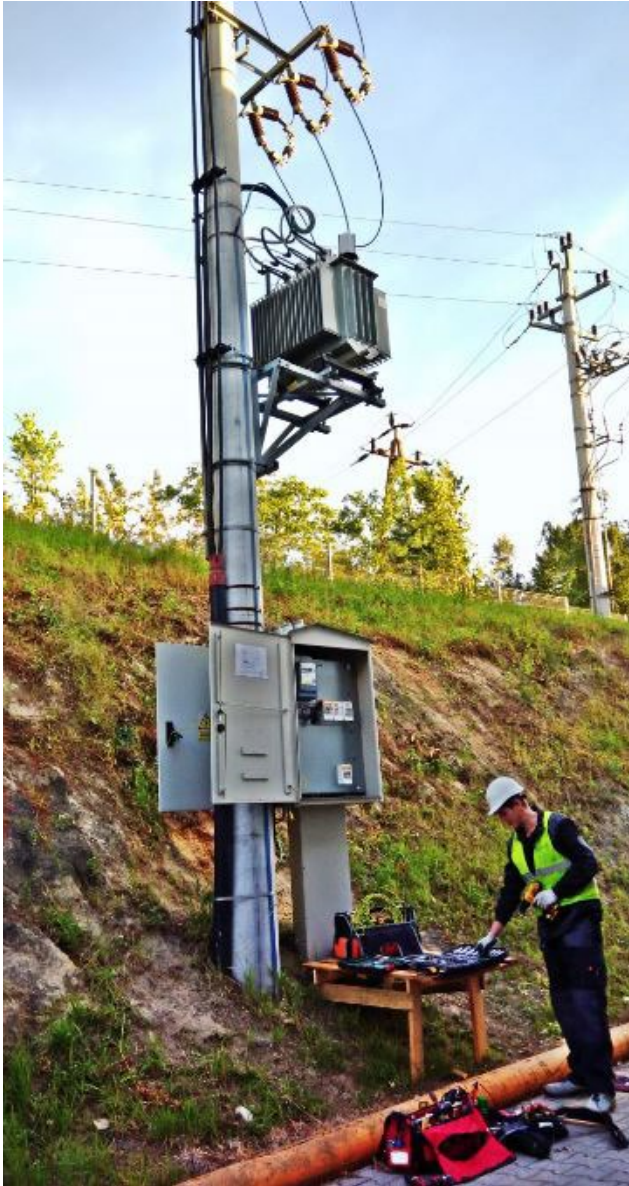
Stacja transformatorowa słupowa SN/nN

https://salwis.pl/stacja-transformatorowa-slupowa-napowietrzna/