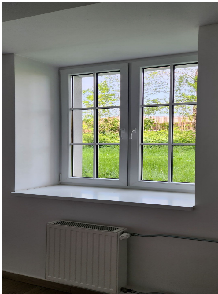
Okna jednopoziomowe, klamki