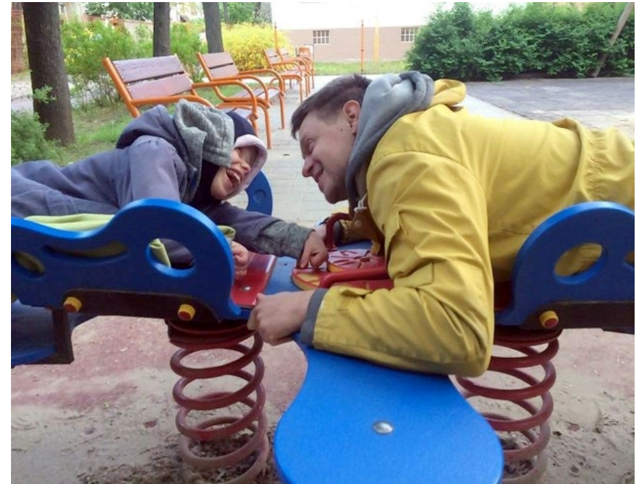
Autor: Angela Greniuk,