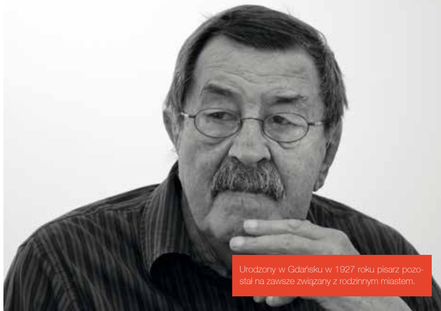
Urodzony w Gdańsku w 1927 roku pisarz pozostał na zawsze związany z rodzinnym miastem.