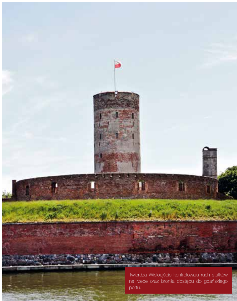
Twierdza Wisłoujście kontrolowała ruch statków na rzece oraz broniła dostępu do gdańskiego portu.

Sytuacja obrońców pogorszyła się po dostarczeniu ciężkiej artylerii. W maju Gdańsk został odcięty od Wisłoujścia i morza. Szczególnie krwawe walki toczyły się o Grodzisko. Wsparcie Francji w wojnie o polską koronę było niewystarczające. W pierwszej połowie maja, po trzech dniach, bez przeprowadzenia jakiegokolwiek akcji zbrojnej, okręty francuskie odpłynęły do Kopenhagi. Druga, liczniejsza i lepiej wyposażona, ekspedycja wylądowała na Westerplatte 23 maja. Dwutysięczny oddział został