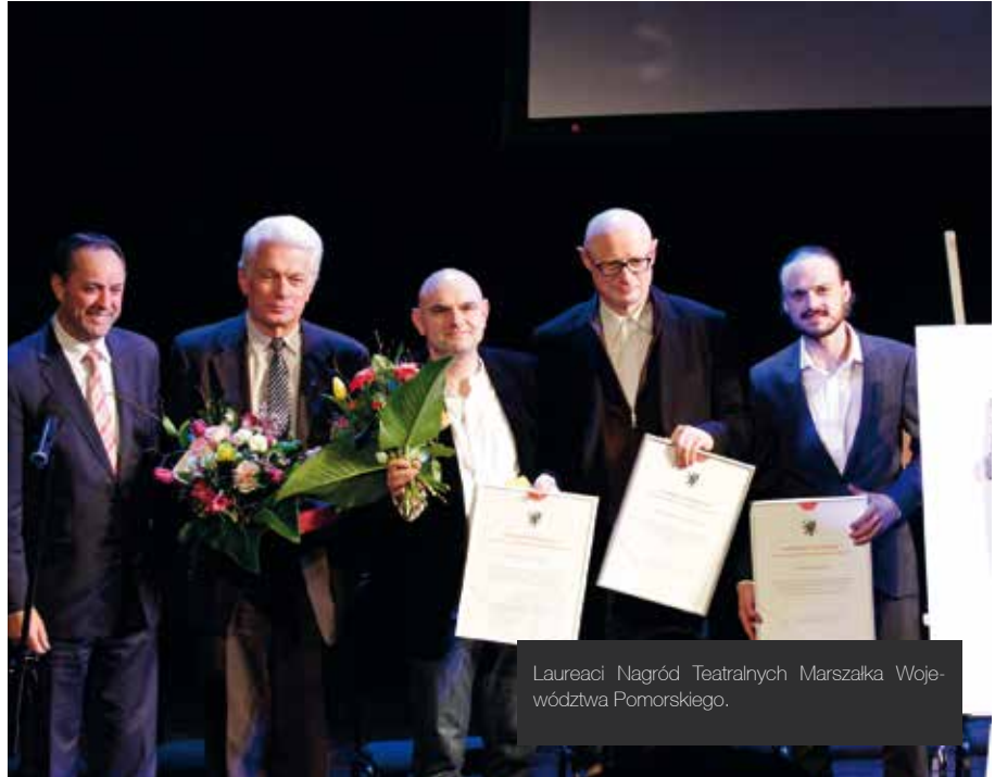
Laureaci Nagród Teatralnych Marszałka Województwa Pomorskiego.