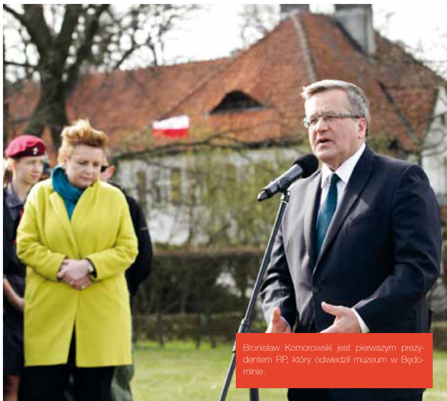
Bronisław Komorowski jest pierwszym prezydentem RP, który odwiedził muzeum w Będominie.

Propozycję zorganizowania w Będominie „Muzeum Hymnu Narodowego”