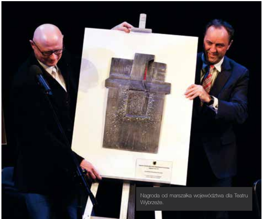
Nagroda od marszałka województwa dla Teatru Wybrzeże.