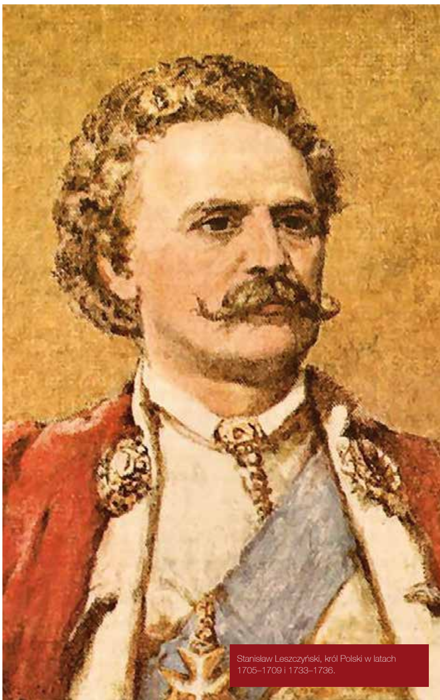
Stanisław Leszczyński, król Polski w latach 1705–1709 i 1733–1736.

W 1704 roku Żuławy zostały zajęte przez Szwedów, którzy zażądali od Gdańska ogromnych kontrybucji, a także poparcia do polskiego tronu Stanisława Leszczyńskiego. Miasto po raz kolejny (i nie ostatni) znalazło się w niezręcznej sytuacji wobec dwóch równoległe wybranych władców Rzeczypospolitej. W 1708 roku nad Motławę przybył król Stanisław Leszczyński, który próbował chronić miejskie po-