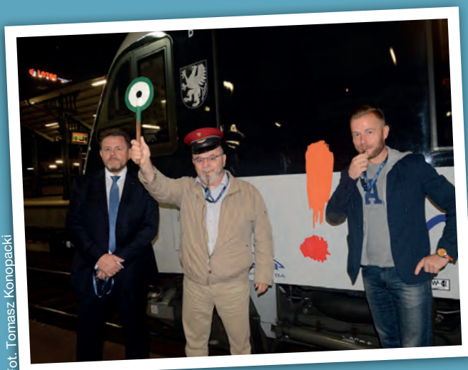
Fot. Tomasz Konopacki