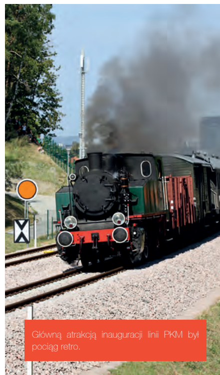
Główną atrakcją inauguracji linii PKM był pociąg retro.

Regularne kursy Pomorskiej Kolei Metropolitalnej rozpoczęły się 1 września. Pasażerowie mają już okazję przekonać się, jak podróżuje się najnowszą linią kolejową w Polsce. Wdrożenie tak wielkiej inwestycji, jaką jest Pomorska Kolej Metropolitalna, może napotykać na początku pewne trudności, tym bardziej że nowa linia musi „wszczepić się” w istniejący już regionalny system transportu kolejowego (regionalne, krajowe i towarowe linie kolejowe). Można się spodziewać, że tzw. rozruch potrwa kilka miesięcy, mieszkańcy muszą się bowiem przekonać i przyzwyczaić do nowego środka transportu, zaś przewoźnik musi poznać oczekiwania swoich pasażerów.