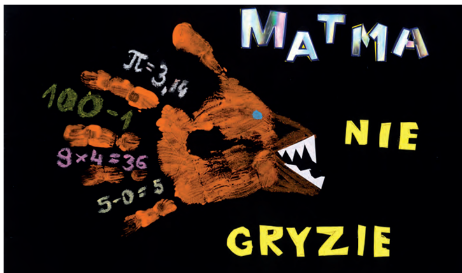
Rys. Tymon Sochaj, lat 7

Celem konkursu był rozwój umiejętności plastycznych wśród dzieci i młodzieży, popularyzacja wiedzy o matematyce, upowszechnienie korzyści płynących z wykorzystania tej dziedziny nauki oraz promocja województwa pomorskiego. Nagrodzone zostały dzieci uczęszczające do przedszkoli, uczniowie szkół podstawowych, gimnazjów oraz szkół ponadgimnazjalnych. Łącznie nadesłano 483 prace, a największe zainteresowanie konkursem było wśród dzieci