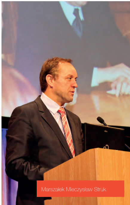
Marszałek Mieczysław Struk

Za pośrednictwem uroczystego listu do uczestników konferencji zwrócił się także Bronisław Komorowski, prezydent Rzeczypospolitej Polskiej: „(...) Gdańsk to szczególne, symboliczne miejsce dla takiej debaty. Idea samorządności, decentralizacji, obywatelskiego współuczestnictwa od samego początku była mocno wpisana w solidarnościowy projekt przeobrażenia Polski. (...) Życzę pomyślności w podejmowanych przedsięwzięciach, w sprawowaniu publicznej służby, w umacnianiu Rzeczypospolitej samorządnej”.