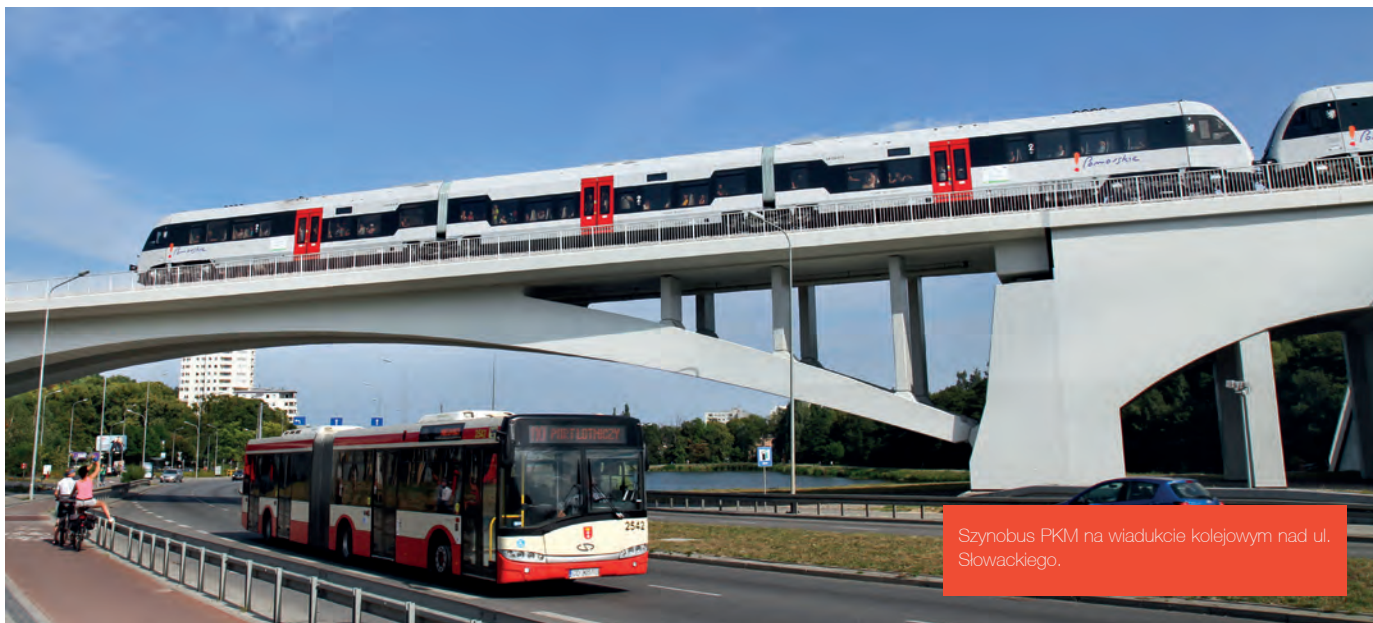
Szynobus PKM na wiadukcie kolejowym nad ul. Słowackiego.